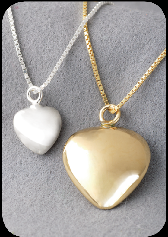
Silber klein: 31001 HZ · vergoldet klein: 31002 HZ Silber groß: 30001 HZ · vergoldet groß: 30002 HZ 14 Karat Feingold (585) klein: 31003 HZ