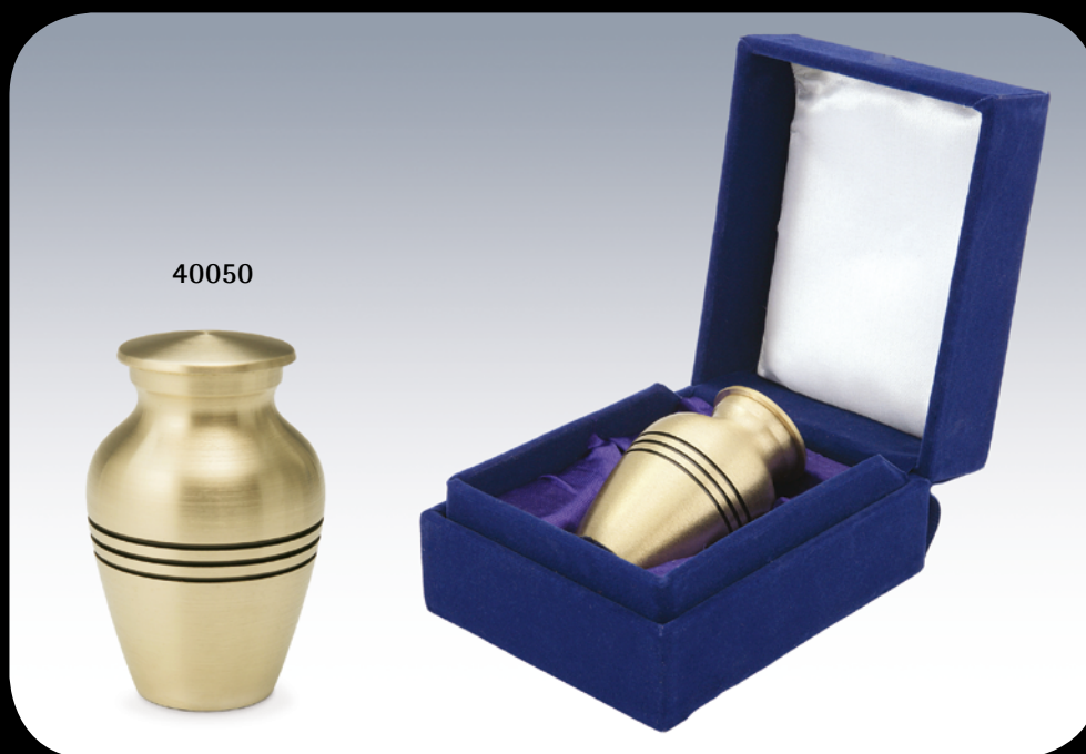
Micro-Urne aus Messing mit blauer Samtdose, Volumen ca. 0,01 ltr.