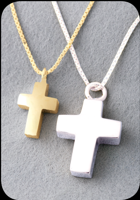
Silber klein: 31001 KZ · vergoldet klein: 31002 KZ Silber groß: 30001 KZ · vergoldet groß: 30002 KZ 14 Karat Feingold (585) klein: 31003 KZ