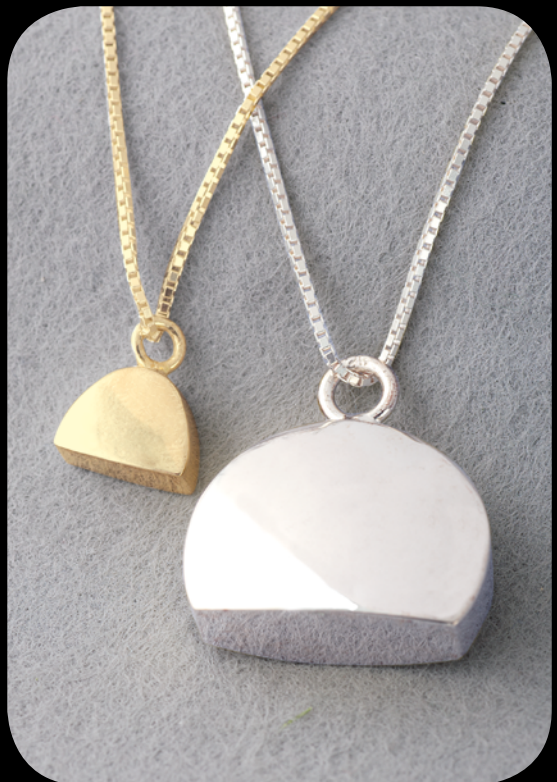
Silber klein: 31001 HS · vergoldet klein: 31002 HS Silber groß: 30001 HS · vergoldet groß: 30002 HS 14 Karat Feingold (585) klein: 31003 HS