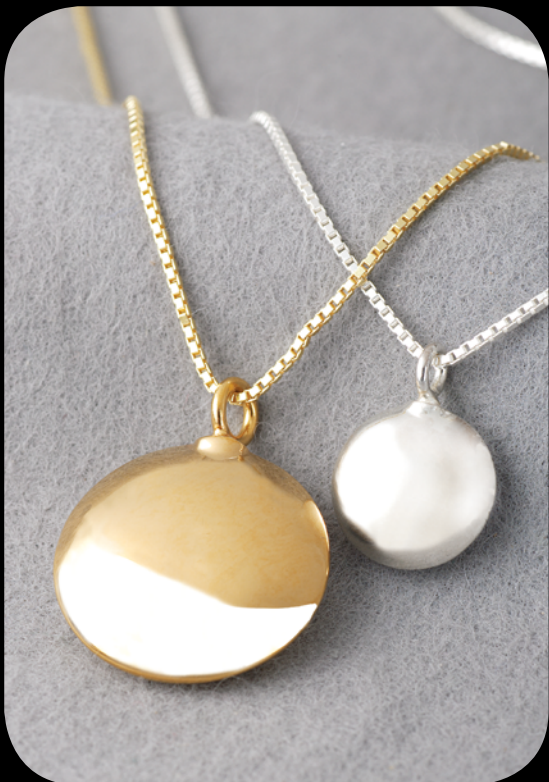
Silber klein: 31001 KS · vergoldet klein: 31002 KS Silber groß: 30001 KS · vergoldet groß: 30002 KS 14 Karat Feingold (585) klein: 31003 KS